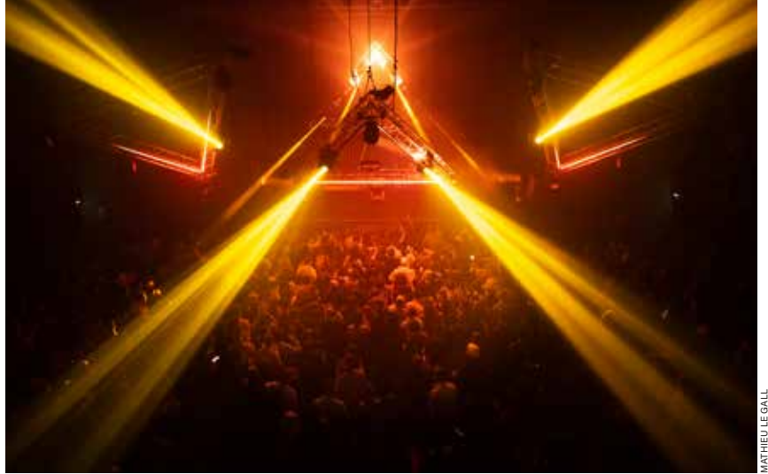
MATHEU LE GALL