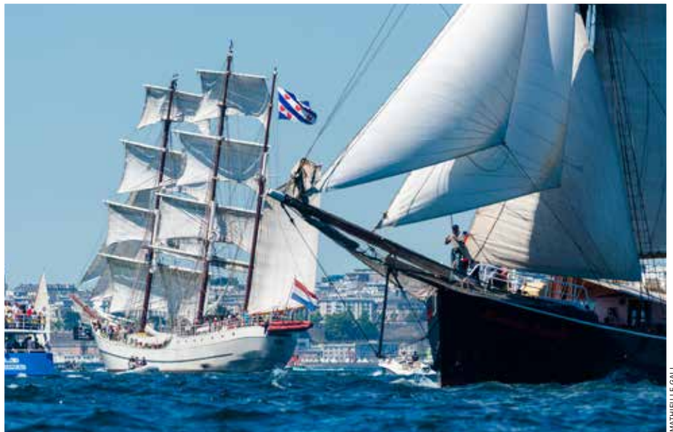
MATHIEU LE GALL