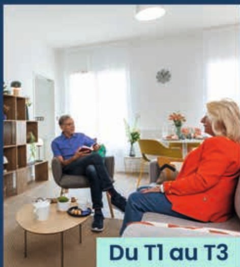
Du T1 au T3

Visitez votre résidence services seniors à Brest