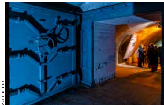
MATHIEU LE GALL