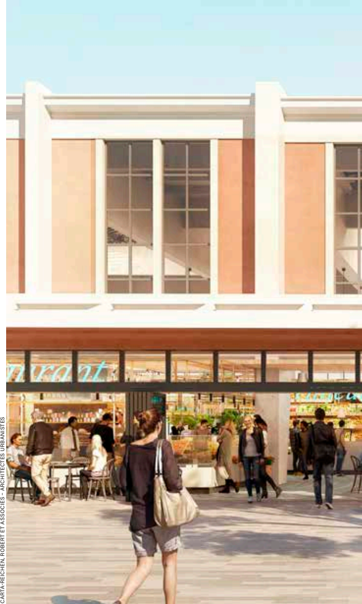
CARTE-REICHEN, ROBERT ET ASSOCIÉS - ARCHITECTES URBANISTES

La partie centrale du bâtiment formera, elle, une place ouverte, pour se poser, manger un morceau... et