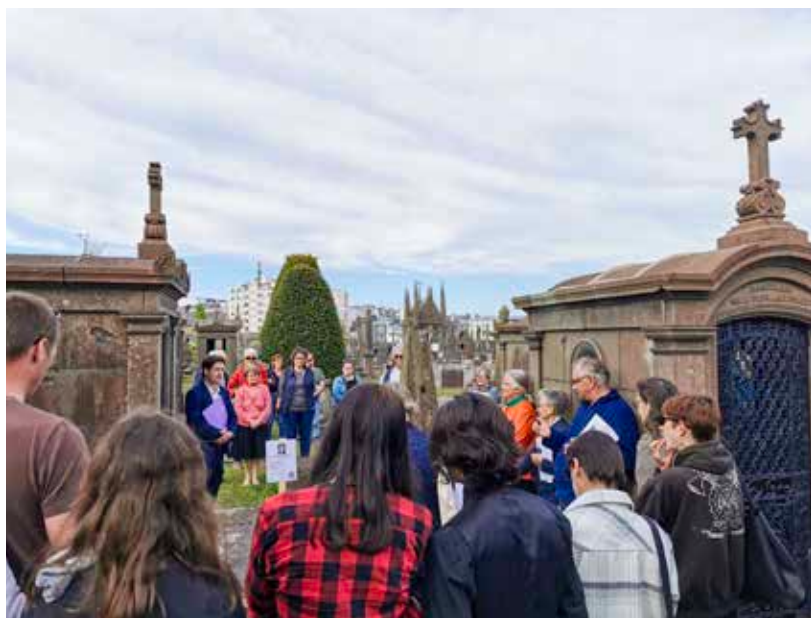
Les cimetières font aujourd'hui partie intégrante de la vie en ville.