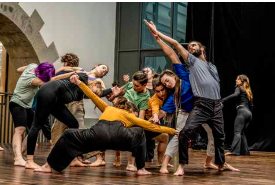
JAKES BALCON PLUIE D'IMAGES-CAPAB