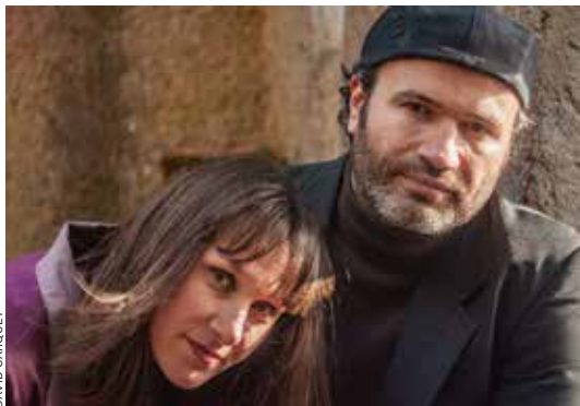
Il y a 18 ans, les Mediavolo ne croyaient pas encore aux contes de fée !