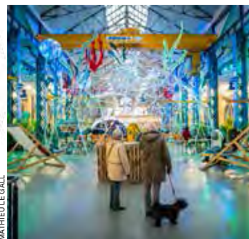
MATHIEU LE GALL

> De 10 heures à 19 heures, entrée libre.