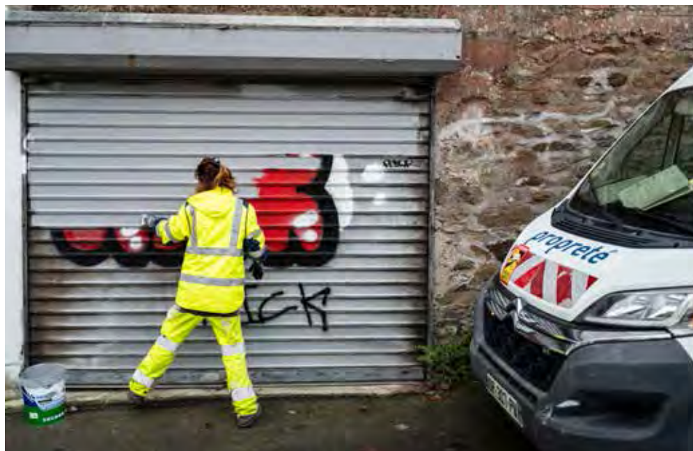
MATHIEU LE GALL

En dehors de cette zone centrale, les personnes concernées par un tag doivent contacter la métropole (02 98 33 50 50), pour déposer une plainte simplifiée, ensuite prise en compte dans le planning d'intervention des équipes. Lesquelles devraient, face à l'augmentation régulière de ces incivilités, se voir renforcées. Deux nouveaux véhicules d'intervention ont par ailleurs été acquis par la collectivité.