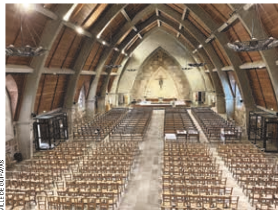
VILLE DE GUIPAVAS

... brest.fr , ville-plougastel.bzh , guipavas.bzh