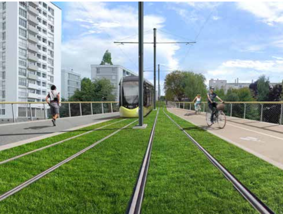
L'ŒIL MOBILE DAMIEN GORET