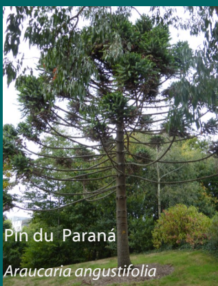
Pin du Paraná

Le territoire de Brest métropole est doté de nombreux arbres remarquables.