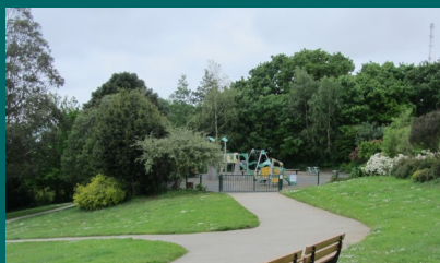
Belvédère du jardin de Kerbonne

Arboré et fleuri, le jardin de Kerbonne est équipé d'une aire de jeux destinés aux enfants de 2 à 12 ans.