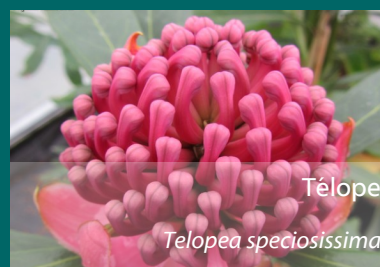
Télope Telopea speciosissima