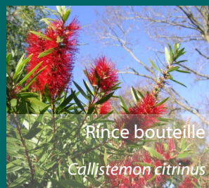
Rince bouteille Callistemon citrinus

C'est sur son emplacement, que s'élevait autrefois « la maison de l'espion », excellent poste d'observation des mouvements de bateaux.