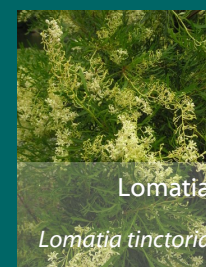
Lomatia Lomatia tinctoria