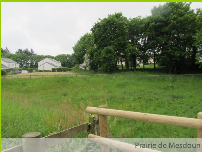
Prairie de Mesdoun

La balade traverse la prairie de Mesdoun implantée autour d'un bassin de régulation des eaux pluviales. C'est un espace de transition urbaine, véritable refuge et corridor pour la faune.