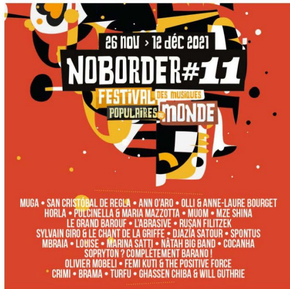
Affiche du festival No Border, à Brest et dans sa région. NO BORDER

A Brest, les frontières musicales s'effacent