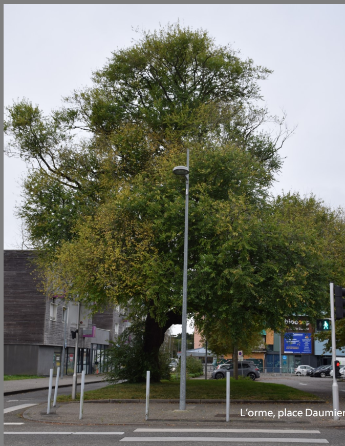
L'orme, place Daumier

Bordant les remparts, les places d'armes, les promenades et les jardins, l'orme fut durant plusieurs siècles l'arbre emblématique de la cité du Ponant. Il poussait spontanément en Bretagne et sa remarquable adaptation au climat océanique brestois en fit une essence de choix pour les besoins militaires. Au cours de la seconde moitié du XXème siècle, la graphiose, une maladie mortelle due à un champignon, décima la grande majorité de l'essence en Europe. Aujourd'hui à Brest, il est le seul rescapé à avoir survécu à cette maladie. Des plantations de nouvelles variétés résistantes à la graphiose sont régulièrement réalisées dans la ville.