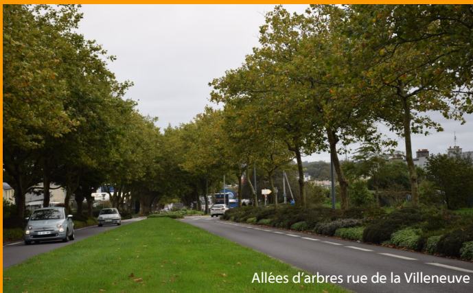
Allées d'arbres rue de la Villeneuve