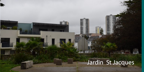
Jardin St Jacques