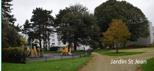
Jardin St Jean